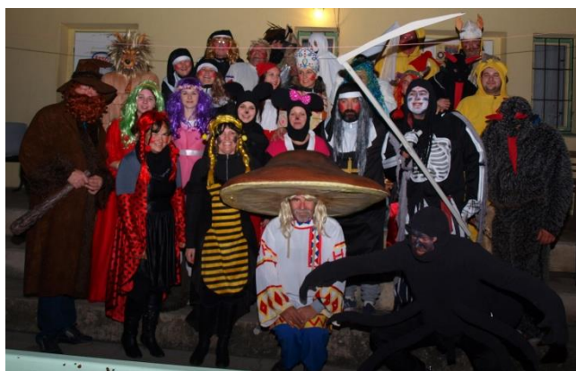
6. 11. 2015 - Halloween ve Starém Mateřově