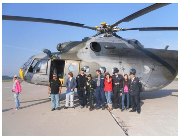
Mateřovští hasiči u vrtulníku Mi-17 na pardubickém letišti.

Požární ochrana očima dětí 2015 je soutěž zaměřená na požární tematiku. Je rozdělena do tří oblastí - literární, výtvarné a zaměřené na digitální technologie. Letošního ročníku této