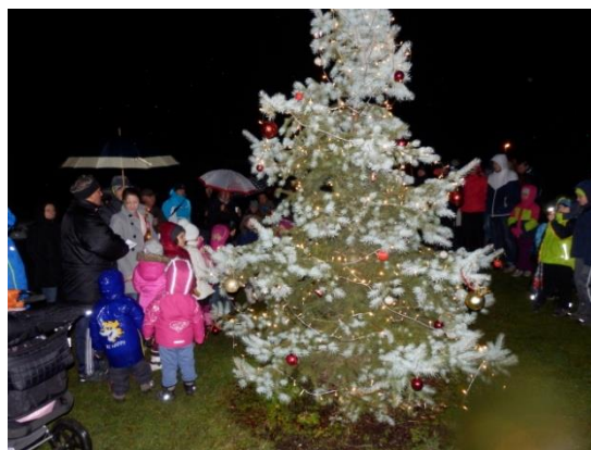
29. 11. 2015 - rozsvícení vánočního stroměčku

Poděkování patří všem, kteří se jakýmkoliv způsobem zapojili do spolupráce při přípravě těchto akcí.