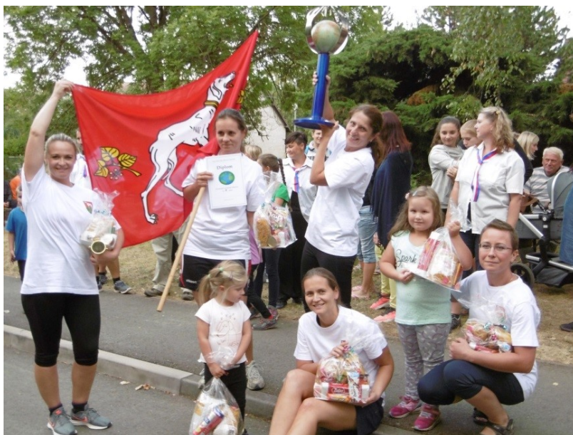
Hry bez hranic 2018: naše vítězné družstvo