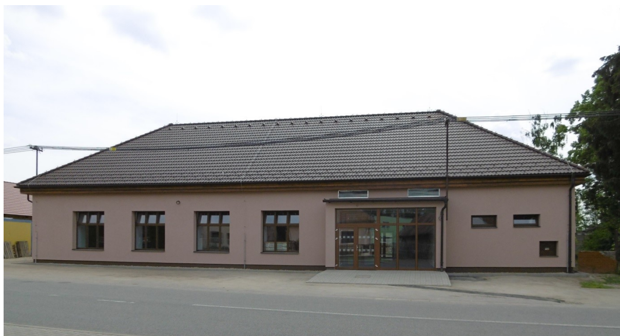
zrekonstruovaný Obecní dům „U Lípy“